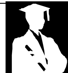
Lo specialista euroAcustici certificato in Acustica, suono e vibrazioni.

L'iscrizione si perfeziona con l'invio della documentazione integrativa e del modulo telematico nel sito INTERNET www.euroacustici.org per l'approvazione del C.D.