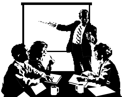
EuroAcustici: formazione e qualificazione professionale del tecnico COMPETENTE